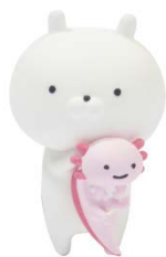
ウーパールーパーをだっこするうさまる