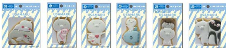
アイシングクッキー（各 800 円）