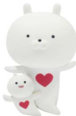
クリオネになるうさまる