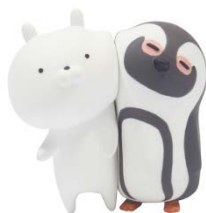
ケープペンギンとじゃれあううさまる