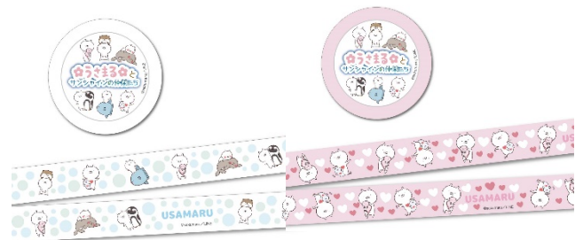
マスキングテープ（各 600 円）