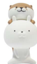
コツメカワウソをあたまにのせるうさまる