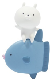
マンボウとおよぐうさまる

販売価格：1回400円（税込） ※ご購入には水族館入場料金が別途必要となります。