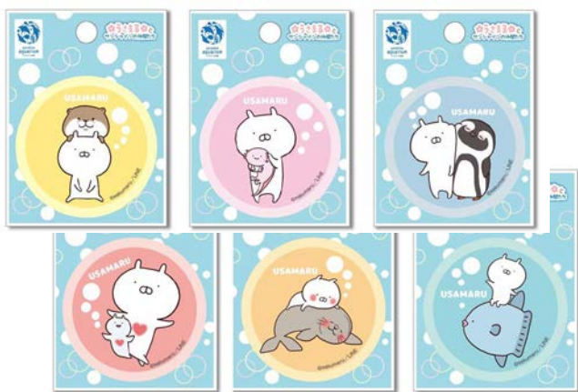
缶バッジ（各 300 円）