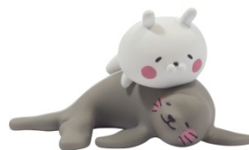
オタリアとリラックスするうさまる