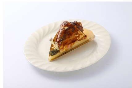
マガキガイケーキ