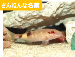
ざんねんな名前 ★オジサンは、メスでも、赤ちゃんでもオジサン

※本特別展開催に先駆け、11月8日（水）に報道関係者向けに先行公開を実施いたします。