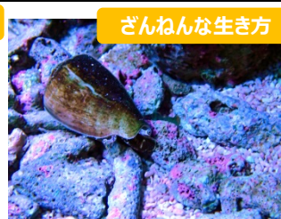
ざんねんな生き方 ★マガキガイは飼育スタッフには人気だが、いつも素通りされる