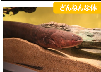
ざんねんな体 デンキウナギはのどに肛門がある