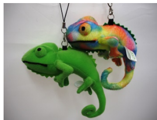
カメレオンのレオくんストラップ グリーン、レインボー 各648円