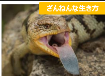
ざんねんな生き方 ★アオジタカゲは青い舌で敵をいかくすが、きかない