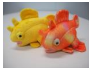
カエルアンコウぬいぐるみ イエロー、オレンジ 各1,058円