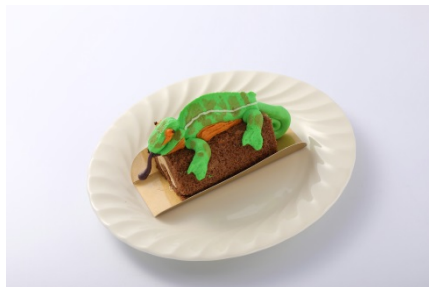
カメレオンケーキ