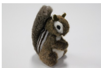
シマリスのぬいぐるみ 864円