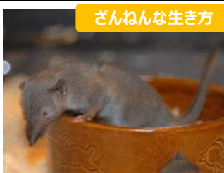
ざんねんな生き方 ジャコウネズミは電車ごっこで歩く