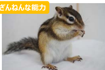
ざんねんな能力 シマリスのしっぽはかんたんに切れるが再生はしない