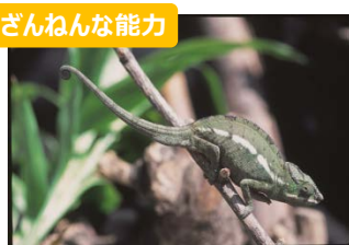
ざんねんな能力 カメレオンの色が変わるのは気分次第