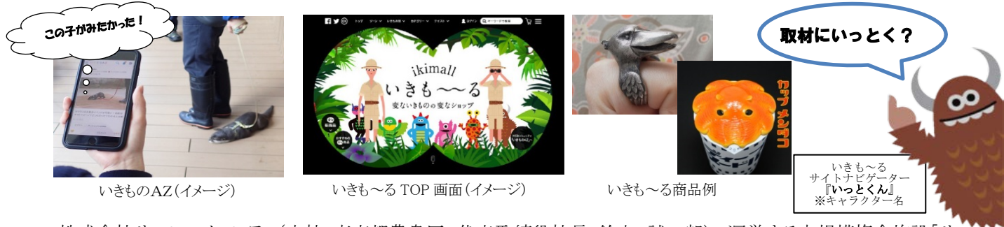
いきものAZ(イメージ)