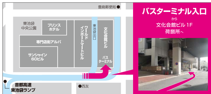
サンシャイン60ビル