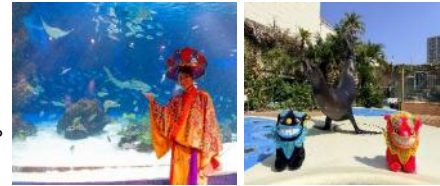
パフォーマンス 沖縄めんそーれフェスタver. (サンシャインラグーンフィーディングタイム、アシカパフォーマンスタイム)

日時：サンシャインラグーンフィーディングタイム 沖縄めんそーれフェスタver. 各日11:00～ アシカパフォーマンスタイム 沖縄めんそーれフェスタver. 各日11:00～、15:30～