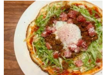
沖縄タコスピッツァ/1,430円 ※数量限定

場 所：豊島区東池袋1-4-4 PAPHILLON BLDG. P-144 B1～2F