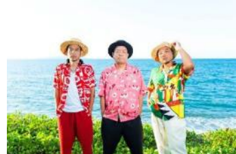
5月28日(木) きいやま商店