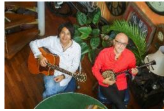
5月30日(土) THE SAKISHIMA meeting