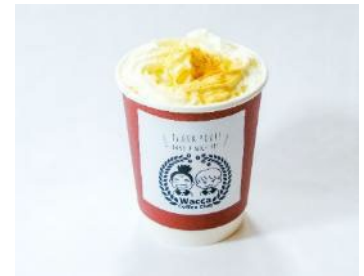
黒糖ウィンナーコーヒー/600円