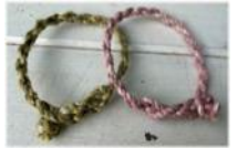
ワークショップでは「ベチバー」を使ってミサンガを作る体験も

その他、 沖縄物産展、噴水広場、水族館の3つのエリアを巡るとオリジナルステッカーがもらえるスタンプラリー を開催します。さらに、館内2階「ショップアクアポケット」では、めんそーれフェスタ期間よりオリジナルニット製エコバッグや、売上げの一部がサンゴの植え付けや保全活動に活用される「Sunna(さんな)ちゃんの恩返し黒糖」も販売しています。また、サンゴプロジェクト20周年の企画として、募金箱を設置しています。集まった募金は、恩納村へ寄付され、サンゴの健康チェック、ビーチクリーンなどの活動に使用いたします。