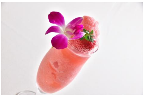
JASMINE THAI（アルパ3F） いちごラッシースムージー 990円 【栃木県産とちあいか 使用】