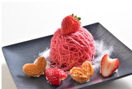
茶鍋カフェ・カグラザカ サリヨウ（アルパ1F） いちご生しばりモンブラン（ドリンク付き） 1,595円 ※各日なくなり次第終了 【栃木県産とちあいか 使用】