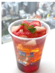
夕暮れストロベリーティー ソーダ (ICE) 750円 夕暮れストロベリーティー (HOT) 750円

【1/23～2/3 熊本県産ゆうべに、 2/4～2/15 長崎県産恋みのり 使用】