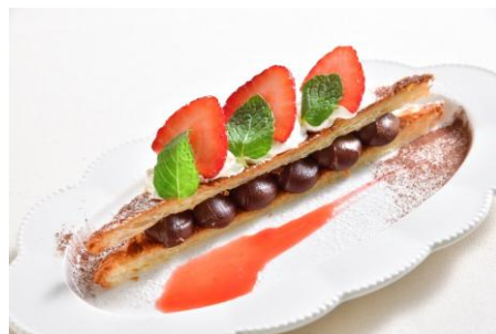
LA VIGNE AKIKO（アルパB1） 苺とダークショコラのクロワッサンミルフィーユ 680円 ※各日限定15食 【栃木県産いちご 使用】