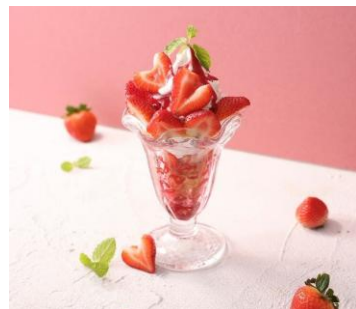
CHEESE & DORIA.sweets（アルパ3F） 栃木県産苺のパフェ〜とちあいか使用〜 1,419円 【栃木県産とちあいか 使用】