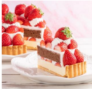
Ducky Duck（アルパ3F） 苺のショコラタルト 1,080円 【栃木県産とちあいか 使用】