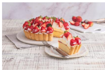
La Maison ensoleille table（アルパ3F） いちごのカスタードクリームタルト（単品） 1,280円 【栃木県産とちあいか 使用】