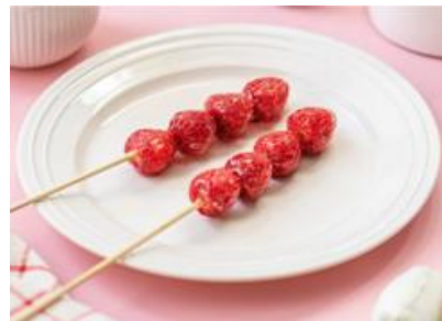
いちご飴と幸せな僕（アルパB1） いちご飴（プレーン）1本 650円 ※画像は2本 【栃木県産いちご 使用】