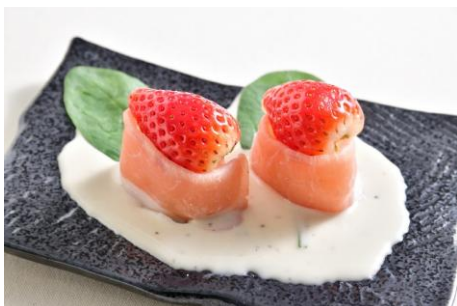
築地玉寿司（アルパ3F） いちごと生ハムにぎり（2貫）440円 ※各日15時〜20時・30食限定 【栃木県産とちあいか 使用】