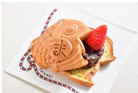
まめものといたい焼き（アルパB1） イチゴ入り つぶあんたい焼き/イチゴ入り こしあんたい焼き 各500円 ※各日なくなり次第終了 【栃木県産いちご 使用】