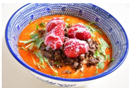
萬力屋（アルパ3F） イチゴミルク担々麺 1,480円 ※各日限定10食 【栃木県産とちあいか 使用】