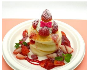
お空のふわふわいちごパンケーキ 1,200円 【1/23～2/3 佐賀県産いちごさん、 2/4～2/15 静岡県産さびび香 使用】