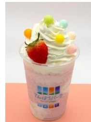
てんくういちごスムージー 880円 【栃木県産スカイベリー 使用】