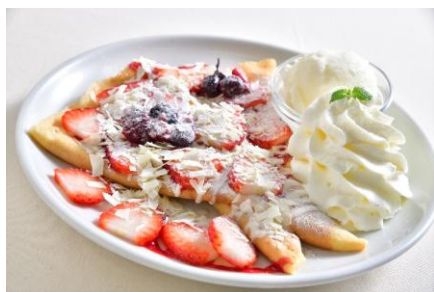
creperie kenny's cafe（アルパ1F） ホワイトチョコストロベリークレープ 1,750円 ※各日なくなり次第終了 【栃木県産とちあいか 使用】