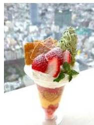
雪降る丘のいちごミルクパフェ 1,200円 【栃木県産スカイベリー 使用】

【1/23～2/3 熊本県産ゆうべに、 2/4～2/15 長崎県産恋みのり 使用】