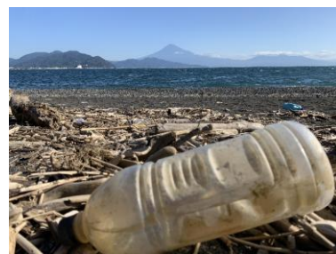
静岡市内で見つかった海洋プラスチック

海洋プラスチックとは、陸上で捨てられたり管理されずに流出したプラスチックが、河川や雨水の流れを通じて海に入り、漂流・漂着したり海底に残ったりするものです。生き物の誤食や絡まり、海岸の景観悪化、漁業・観光への影響など、環境と社会に幅広い負担をもたらします。海に出たプラスチックは細かく砕けてマイクロプラスチックとなり、回収が難しい点も大きな課題です。また、2050年には海洋中のプラスチックの重量が海洋の魚の総量を上回るとの試算もあり、喫緊の課題となっています。海洋ごみの多くは陸由来とされるため、海だけでなく流域全体での発生抑制が重要です。国内外問わず、使い捨てプラスチックの削減や分別・回収の強化、再生材の活用など、資源循環を進める取り組みが加速しており、大阪・関西万博でも重要なテーマの一つとして取り扱われました。