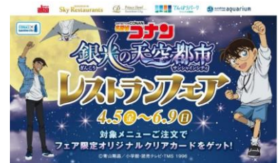
「名探偵コナン」とコラボした全館イベントに合わせレストランフェアも開催

複合施設の強みを活かし、展示ホールや水族館・展望台などサンシャインシティ内各所で開催されるIPコンテンツをテーマとしたイベントとのコラボ企画として、レストランフェアの開催などを行いました。アパレルなどの物販店舗においても、IPコンテンツとのコラボ商品などを積極的に展開することで、イベント来場者にも非常に好評を得ています。また、「セサミストリートマーケット」や「サンリオビビティックス」、「ポケモンセンターメガトウキョー」などのアルパ内のキャラクターショップによる噴水広場や展示ホールでのイベント・フェアの開催も、店舗売上の拡大に大きく寄与しました。