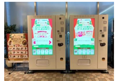
外部企業とのコラボ企画に合わせたノベルティのプレゼントを自販機で実施

これまで未利用または別の用途で利用していた場所を店舗区画化し、売上の上積みを図りました。また、外部企業や自治体とのコラボ、IPコンテンツとのコラボに多角的目づ複合的に対応出来るように、自販機やキッチンカーの展開を開始し、お客様満足度向上と売上拡大に繋がりました。