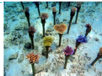
恩納村の海中でサンゴを養殖する様子

また、恩納村は2018年7月に「サンゴの村～世界一サンゴと人にやさしい村～」を宣言し、2019年7月には「SDGs未来都市」及び「自治体SDGsモデル事業」に選定されています。