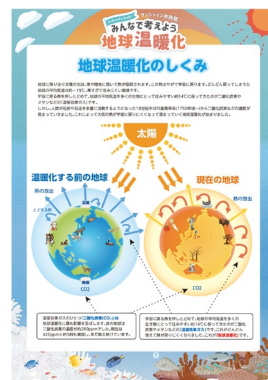
解説パネル イメージ

地球温暖化が引き起こされた原因をはじめ、環境変動やサンゴへの影響や温暖化防止のための森林保全について紹介する解説パネルを設置します。さらに、温暖化の影響をより実感してもらえるよう、水産物の価格高騰などの身近で起きている影響も紹介します。