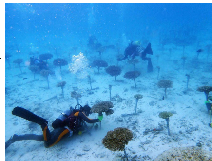
沖縄県恩納村の海中でメンテナンスをする様子

サンシャイン水族館サンゴプロジェクト公式ウェブサイト https://sunshinecity.jp/file/aquarium/coral_project/