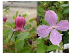
ティンクル ベリー

( https://sunshinecity.jp/event/entry-31786.html ) でお知らせします。