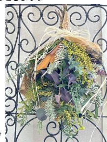
フレッシュグリーンズワッグ