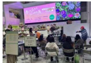
セミナーの様子(昨年)

参加方法：会場でのご購入上げレシートを受付に提示 ※なくなり次第終了 ※詳細は公式ウェブサイトをご確認ください。