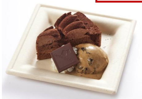
てんぼうパークCAFE (サンシャイン60展望台) ショコラプレート森永のカレ・ド・ショコラを添えて 850円 【カレ・ド・ショコラ 使用】