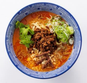
萬力屋 (アルパ3F) 森永の小枝ショコラ担々麺 1,200円 ※1日限定10食 【小枝 使用】