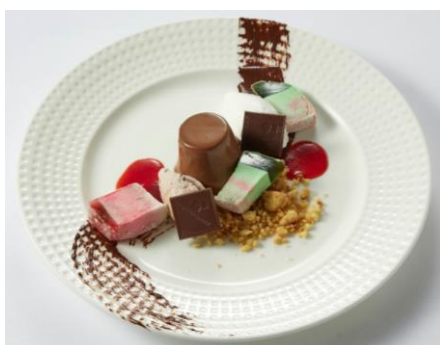
オーシャンカシータ イタリアンシーフードグリル (サンシャイン60・59F) チョコレートパンナコッタ 1,210円 【カレ・ド・ショコラ、ミルクココア 使用】