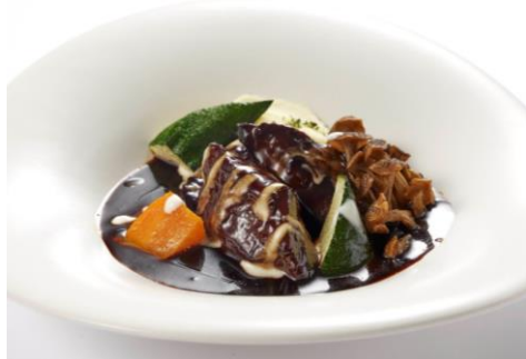
ジンジャーズピーチサンシャイン (サンシャイン60・59F) ジンジャーズピーチ特製ビーフシチュー 森永ダースのアクセント 2,200円 【ダース 使用】