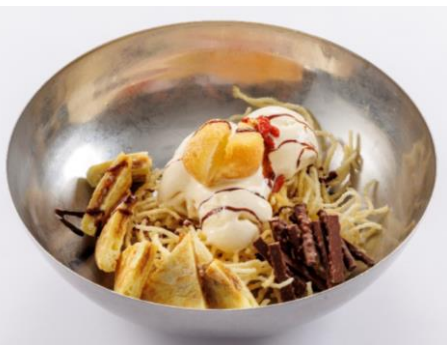
韓豚屋 (アルパ3F) 森永の小枝を使った韓国パフェ 1,280円 【小枝 使用】