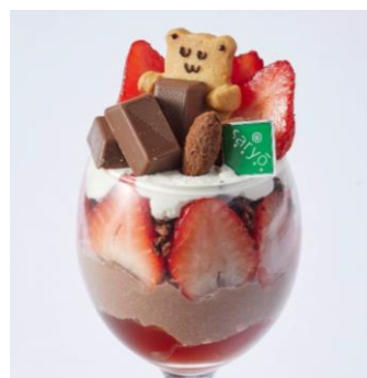
茶鍋カフェ・カグラザカ サリウ (アルパ1F) 和紅茶香る森永ダースのいちごパフェ 1,430円 ※1日限定5~6食 【ダース 使用】