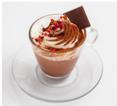
ラ・マゾン アンソレイユターブル (アルパ3F) ローズショコラベリー 900円 【カレ・ド・ショコラ、ミルクココア 使用】