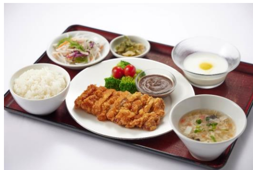
中華旬彩料理・火鍋 聚 (アルパ3F) 若鳥唐揚げ&森永ダースを使ったチョコセット 1,500円 【ダース 使用】