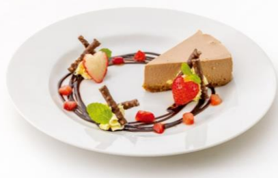
CHEESE & DORIA.sweets (アルパ3F) 森永ミルクココアのレアチーズケーキ 979円 【ミルクココア、小枝 使用】