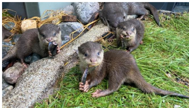
8月11日(生後76日目)の様子