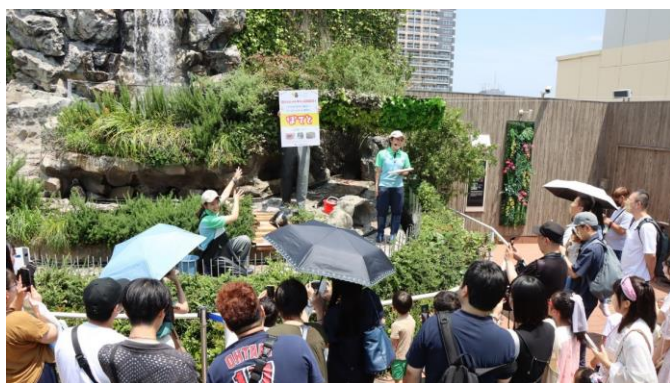
「草原のペンギン」水槽で愛称を発表。猛暑にも関わらず約50名の来館者が見守る中公約の実施と個体識別リングの装着を行った。