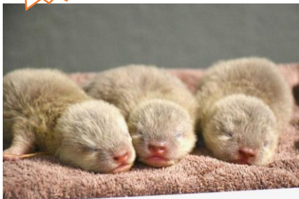
生後9日目のコツメカワウソの赤ちゃん