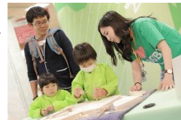
トレジャーハンター化石発掘体験の様子