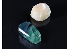
鉱石（磨かれた状態）