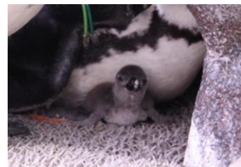
親の足元にいる雛