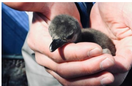
赤ちゃん当時のおいも