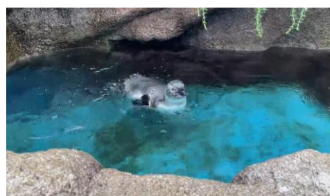
うまく泳げず自主練中のおいも(当時生後4か月)