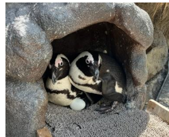
孵化数日前に卵を親元へ戻した様子

サンシャイン水族館では、これまで孵化の前後と子育て期間中は親仔ともどもバックヤードにてその様子を見守ってきましたが、お客様に間近で生まれたての赤ちゃんの姿と子育ての様子を見ていただきたいという思いから展示面にて両親が安心して、子育てができる環境を整えました。