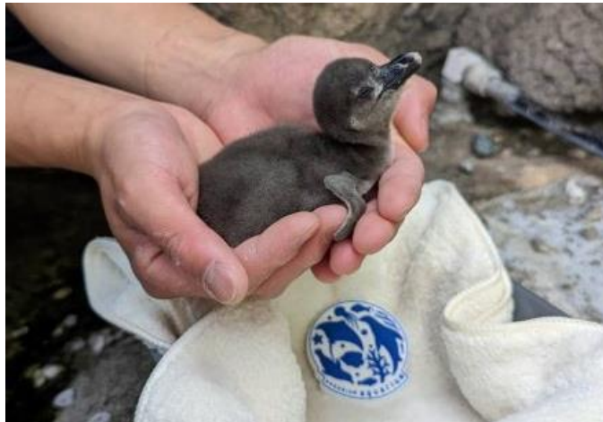
生後4日目の様子（5月22日）

初の試み!生まれたての赤ちゃんの姿と仔育ての様子が間近で観察できる サンシャイン水族館「草原のペンギン」水槽にて