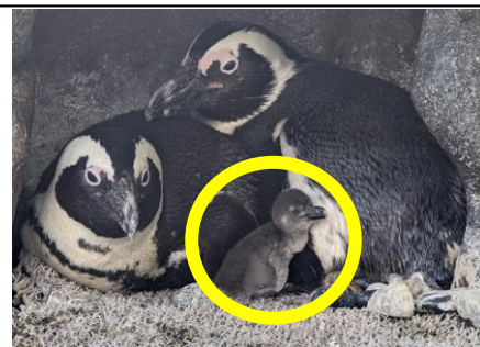
生後3日目の様子(5月21日)

※ペンギンの性別は外見から判断することが難しく、 確実な雌雄の確定は、成長後のDNA鑑定が必要