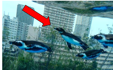
「天空のペンギン」水槽で泳ぐおいも

2023年2月に「赤ピンク」と「緑ライム」の間に初めて誕生した「おいも」。「草原のペンギン」水槽にて展示していた1歳の頃のおいもは、泳ぎが苦手で飼育スタッフを心配させていましたが、現在は親離れし、「天空のペンギン」水槽へ移動。周りのペンギンたちに少しもまれながらも成鳥に混じって悠々と泳いでいます。