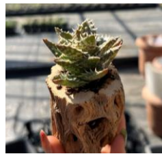
アロエ翡翠殿（ひすいでん）