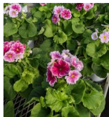
プリムラ・オブユニカ