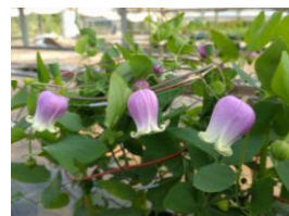
フェルマータピンク