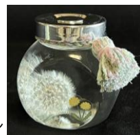
“たんぽぽ”の綿毛の ハーバリウムとタッセル