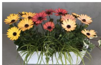
オステオスペルマム

青の万重咲（まんえざき、まんじゅざき）のクレマチス。丈夫で花付きのいい品種。この苗は本展でしか手に入らない希少な苗です。