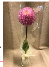
プレゼントするダリア1輪 イメージ

また、イベント期間中、スカイレストランのお食事のレシートまたはてんぼうパークCAFEの合計1,000円以上のご利用レシートをメイン会場（サンシャインシティ 噴水広場）にお持ちいただいた方にはダリア1輪をプレゼント！（各日先着50名様）