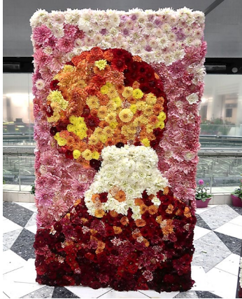
ダリアウォールが4年ぶりに登場!

産地直送ダリアの販売やダリア摘み・ステージイベントなど てんぼうパークをイメージした“ダリアパーク”をテーマに開催