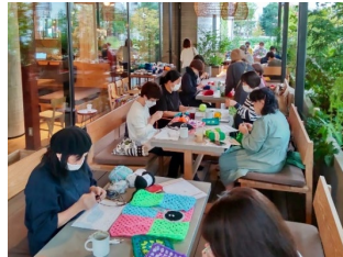
モチーフづくりのイメージ（過去開催時）

講師の指導のもと編みものワークショップを通じて地域交流を深め、ひとりひとりが編んだモチーフがニットアートへと変わり、池袋に彩りを添えます。