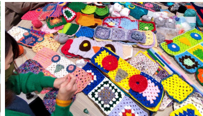
つなぎ合わせワークのイメージ（過去開催時）