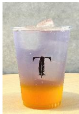
SKY MUSEUM SOUR ～レモン&長崎みかん～