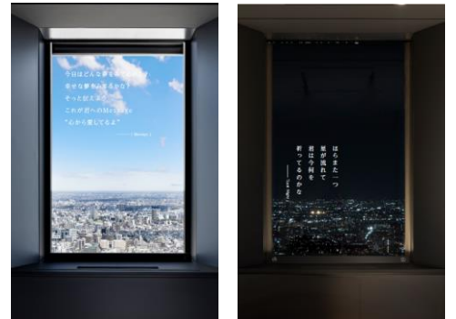
展望台の窓面を活用した「歌詞」と「景色」が融合したアート