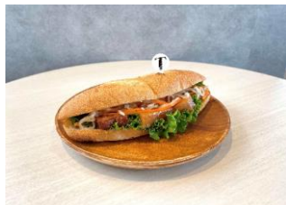
SKY MUSEUM BANH MI ～長崎角煮バインミー～