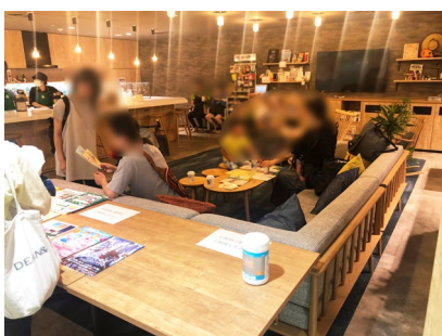
休憩スペースで団らんするご家族の様子