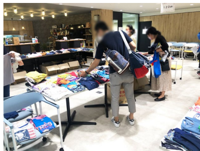
子ども服を選ぶ様子