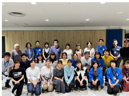
産・学・官・民が連携したボランティア

サンシャインシティでは今後も引き続き、子ども服マーケットの開催や豊島区の区民ひろばとの連携等を通して、地域の方々とともにまだ着られる子ども服を必要とされる場所へお届けする活動をしてまいります！