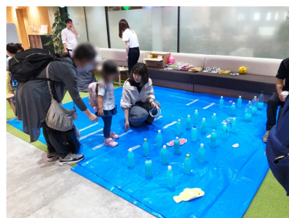
立教大学学生ボランティアの企画コーナー