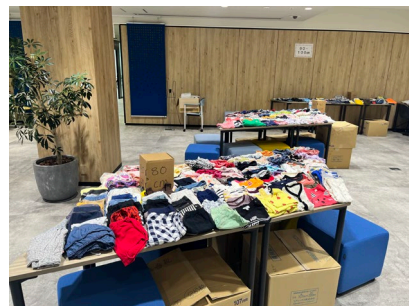
サイズごとに分けられた子ども服