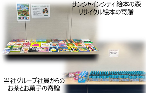
サンシャインシティ 絵本の森 リサイクル絵本の寄贈