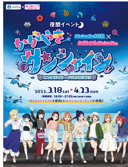
※サンシャイン水族館調べ

「ラブライブ！サンシャイン!!」に染まった夜のサンシャイン水族館をお楽しみください。