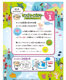
サンゴクイズラリー