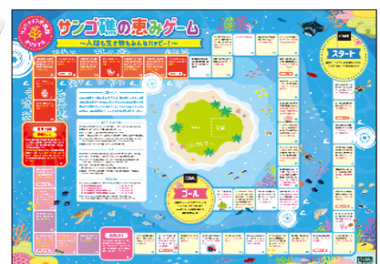
サンゴ礁の恵みゲーム