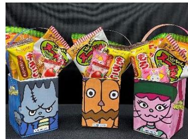
キャンディBOX台紙見本(全3種)

参加条件：館内で配布中のチラシやイベント公式ウェブサイトにて公開された台紙と紙パックで作ったキャンディBOXをご持参の小学生以下の方 ※お一人様1回限り ※各日先着400名様