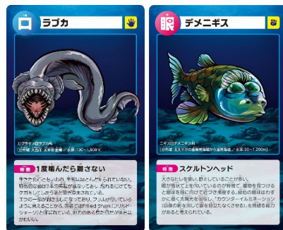
ゾクゾク深海カード（左：ラブカ、右：デメニギス）