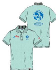
水族館スタッフが期間中着用する、マンシングウェアとのコラボポロシャツ