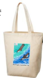
オリジナルエコバックイメージ