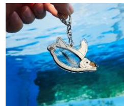
ペンギンの羽入りキーホルダー 495円

※近県での高病原性鳥インフルエンザの発生を受け、生物保護の観点から屋外エリア マリンガーデン「天空のペンギン」水槽は防護ネットなどの対策を講じて展示、「草原のペンギン」水槽は当面の間展示を休止しております。 ※状況により、内容・スケジュールが変更になる場合がございます。※画像はイメージです。※金額はすべて税込です。