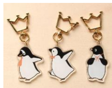
アクリルストラップ 各750円 (作家名：しばさな)