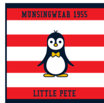
オリジナルミニタオル