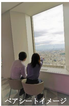
ペアシートイメージ