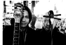
THE SAKISHIMA meeting