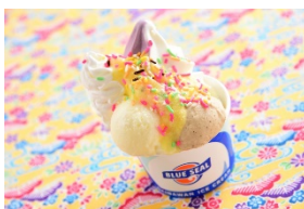
〜海塩「ぬちまーす」使用〜 美ら☆サンデー(470 円) ブルーシール[アルパ B1]

石垣の日差しが育てた極上のパインを使用したメニューや、沖縄の気候・風土の中で育まれた爽やかな味わいのオリオンビールとおつまみをセットにしたちよい呑みメニューが味わえます。また、フェアメニューをご注文の方に手作り貝殻つきメモスタンドをプレゼントします。