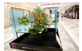
花いけバトル大型花装飾 イメージ

また、沖縄めんそーれフェスタの期間中、本イベントに出演したバトラーを含む、計5名の花いけバトラー達による大型花装飾作品がサンシャインシティ館内に展示されます。