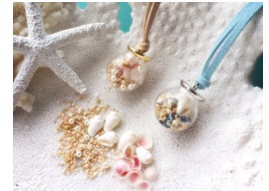
ガラスドームネックレス

Cafe Quu Quu Quu にて、土日限定で沖縄の貝がらや星砂等を使用したフォトフレームやアクセサリーのワークショップを実施します。その他、おしゃれなアクセサリーの販売もあります。