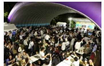
昨年開催の様子 (ビアガーデン)

オリオンビール（生）を 500 円で販売する「めんそーれビアガーデン」を沖縄物産展の屋外特設会場で同時開催します。物産展会場内イートインスペースやビアガーデンでは、三線ライブやエィサーなど、沖縄ならではのスペシャルステージもお楽しみいただけます。