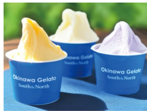
沖縄ジェラート (シングル) (各 380 円)