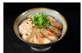
ローストポーク丼 (800 円)