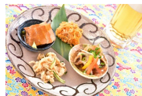
沖縄おつまみちよい呑みセット (1,000 円) 海人酒房[アルパ 3F]