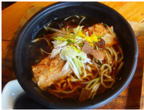
琉球ソーキ醤油拉麺 (650 円)

さらに今年は、物産展内で白米と好きなおかず 4 品をチョイスして沖縄食材たっぷりのオリジナルランチが楽しめる平日限定イベント「自分で作る沖縄弁当！」を実施します（※ランチキット（600 円）を購入）。※なくなり次第終了となります。