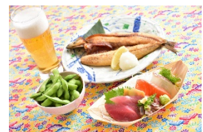
沖縄ちよい呑みセット (1,000 円) 築地食堂 源ちゃん[アルパ 3F]