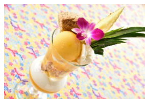
石垣パインとココナツの エキゾチックパフェ(980 円) ゴールデンシャワーツリー[アルパ B1]