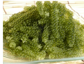
海ぶどう ※80g (900 円)