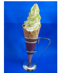
ユージュレナソフトクリーム

◆カナロア カフェでは、沖縄雪塩を使用した「サンシャイン水族館オリジナルソフトクリーム～めんそーれ ver.～」(400 円) や、風化したサンゴで焙煎した沖縄限定の「35COFFEE」(350 円) などを販売します。さらに、 約 1 億個の石垣産ユージュレナ(和名：ミドリムシ)を使用したオリジナルメニュー「ユージュレナソフトクリーム」(400 円) と「ユージュレナカルピス」(350 円) も販売【協賛：(株)ユージュレナ】 。また、店内には琉球イラストレーション作家・与儀勝之氏の作品展示や、海の中をイメージした装飾を実施します。普段とは一味違った琉球感あふれる店内で、ごゆっくりお食事をお楽しみいただけます。