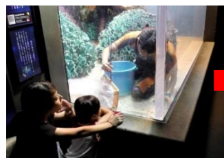
手早く生物を保護(応援してね！)