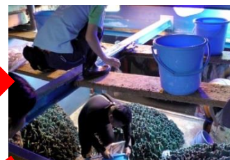
水槽の上にいるスタッフに手渡し