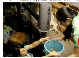
バックヤードは狭いのでバケツリレーで移動