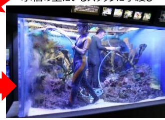
空になった水槽を大掃除

サンシャイン水族館（東京・池袋、館長：丸山克志）では、 気持ちよく新年を迎えるため、年に数回実施している水槽の大掃除「水槽ピカピカ大作戦！」を年の瀬が迫る12月5日(木)と12月9日(月)の夕方に実施します。