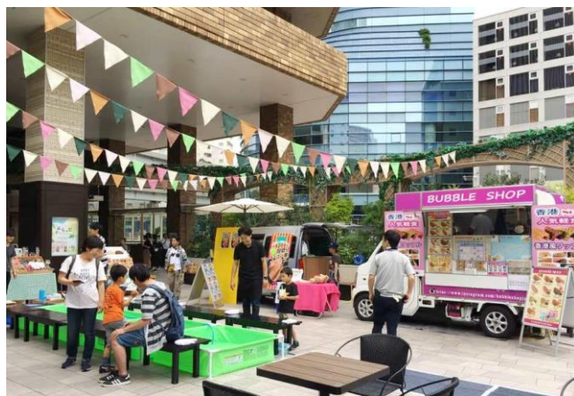
ぷらっとプチマルシェ会場（アルパ1階 西入口）

さらに、クラフトビールやおしゃれな缶詰を楽しむ お月見缶詰 BAR では、高価な缶詰や変な缶詰が当たる巨大なルーレットゲームも登場。ピカチュウやラスカルによる キャラクターグリーティング も日時限定で実施します。