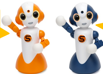
コミュニケーションロボット「Sota®」