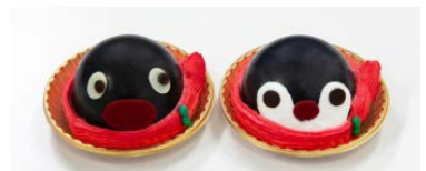
（左）ピングーケーキ （右）ピンガケーキ（各734円）