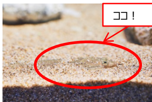
ヒラマ 擬態レベル Lv.3 名人→Lv.5 神

砂地に生息するヒラマは体内にある色素胞を使って擬態を行っており、背景に合わせて色を変化させる擬態の上級者。砂地が反射する光の量を感じて、色素胞を拡散させたり、集合させたりして、体表の模様を作り出している。どこにいるかわからない！というお声を多くいただいたため、今回擬態レベルをアップしました。