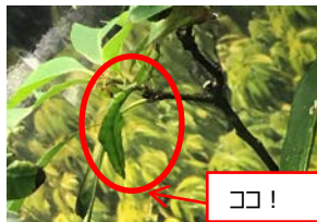
コノハムシの仲間 擬態レベル Lv.5 神

じめじめと湿った熱帯雨林に生息している。木の葉に擬態し、捕食者から見つからないようにしている。日中は葉の裏などにくっついてじっとしているが、夜になると動き出し木の葉を食べる。