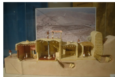
デル・エル＝メディーナ家屋復元模型