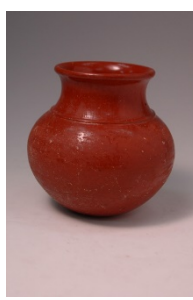
赤色磨研壺 （紀元前 8 世紀）