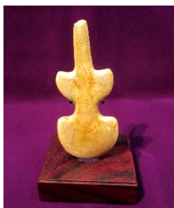
大理石製ヴァイオリン型偶像 （紀元前 3200～2900 年頃）

この機会にぜひ、人類の文明発祥の地「古代オリエント」について情報発信を続けて 40 年目となる古代オリエント博物館へお越しください。