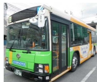
都営バス (イメージ)

乗入開始日： 2018年4月1日(日)～ 乗入路線： 池86路線(池袋⇄渋谷) バス停表記： 「池袋サンシャインシティ」 (文化会館ビル1階 サンシャインバスターミナル内に設置)