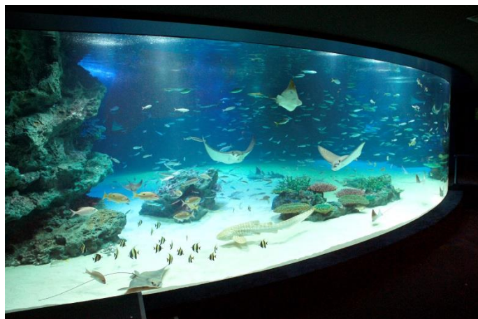
サンシャイン水族館の「サンシャインラグーン」水槽

所 在 地：東京都豊島区東池袋 3-1 サンシャインシティ サンシャイン 60 ビル・60F 営業時間：10：00～22：00 ※最終入場は終了 1 時間前 ※変更になる場合がございます 入 場 料：大人 1,200 円、学生（高校・大学・専門学校）900 円、子ども（小・中学生）600 円、幼児（4 才以上）300 円 ※VR 料金別途 問合せ先：SKY CIRCUS サンシャイン 60 展望台 03-3989-3457 http://www.sunshinecity.co.jp