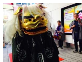
獅子舞の練り歩き

＜場所：屋外エリア「マリンガーデン」※雨天時はエントランス 時間：11：30頃～＞