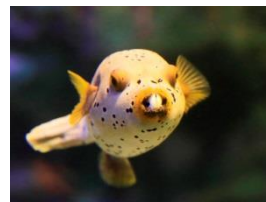
コクテンフグ（英名ドックフェイスパファー）