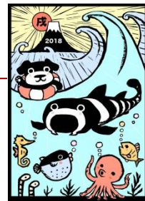
オリジナルクリアファイル（表面）

サンシャイン水族館からのお年玉！2018年の干支「戌」にちなみ、イヌザメのイラストを使用したお正月限定オリジナルクリアファイルを各日先着500名様にプレゼントします。