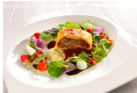
サンシャインクルーズ・クルーズ