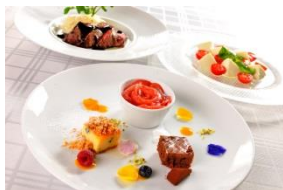
オーシャン カシータ イタリアン シーフード グリル

内容：彩り鮮やかな限定ランチメニューが登場します。最高の景色とともにお楽しみください。