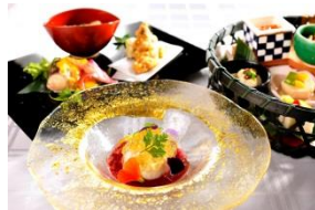
天空の庭 星のなる木