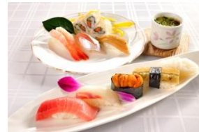
鮭処 銀座 福助