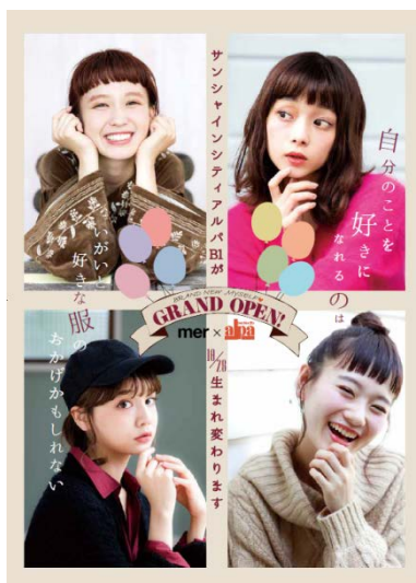
グランドオープン イメージビジュアル