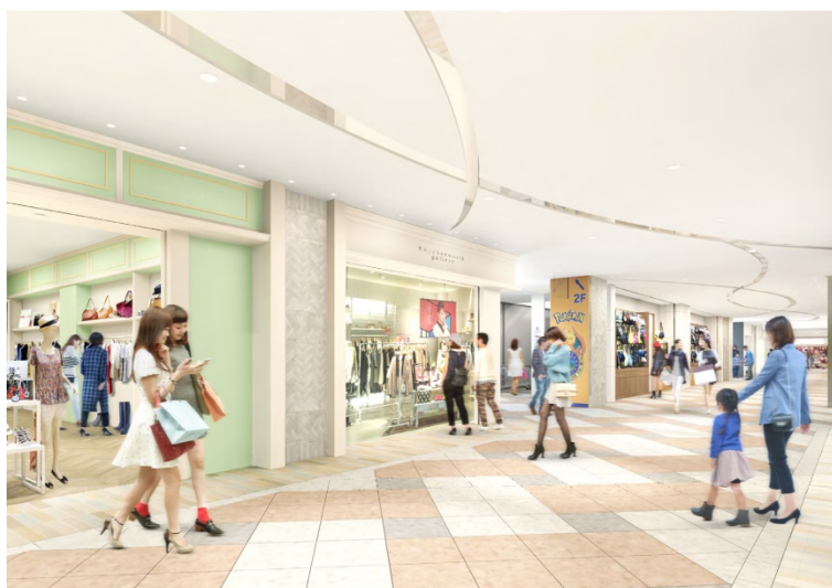
アルパ B1 フloor