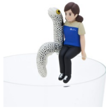
チンアナゴとコップのフチ子