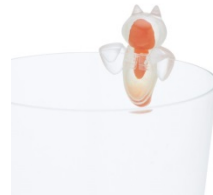
クリオネ (ハダカカメガイ)