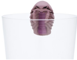
ダイオウグソクムシ