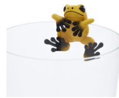
モウドクフキヤガエル